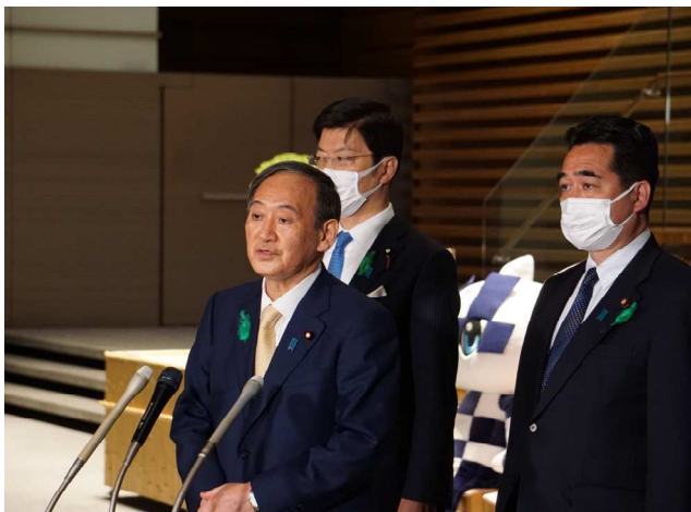
出発前に米国訪問等についての記者会見(官邸にて)

バイデン大統領は執務室のあちらこちらに飾ってある家族写真を菅総理に見せ、一人ひとりについて説明してくれたそうです。その結果、話が盛