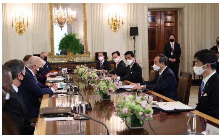
最小限に人数を絞った形での会談。この場の雰囲気も含めてブリーフを行うのがさかい学の仕事

このブリーフですが、結果として政府を代表しての見解にもなってしまうので、大げさに言え